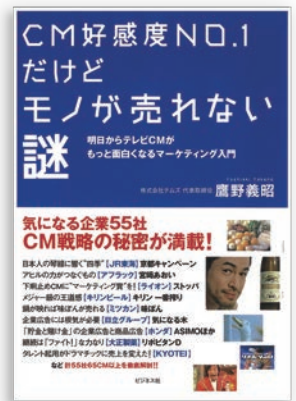
著書「CM好感度NO.1 だけどモノが売れない謎」